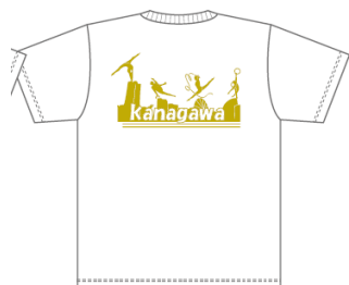
ホワイト (ゴールド)

【Tシャツ】 税込み 大人用(S/M/L/XL)2,000円 子ども用(130/140/SS)1,700円