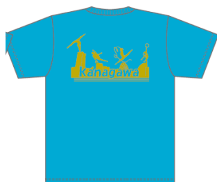
ターコイズ (ゴールド)