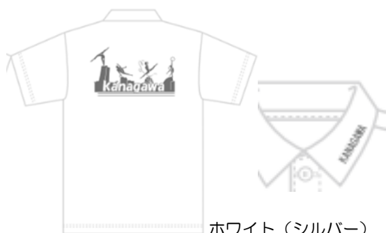
ホワイト (シルバー)