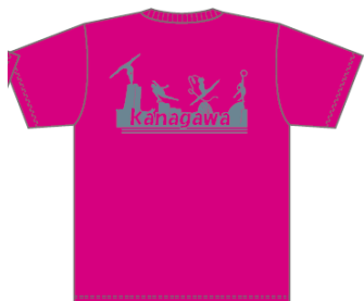
トロピカルピンク (シルバー)