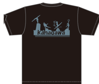
ガンメタル・ブラック (シルバー)