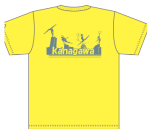
イエロー (シルバー)