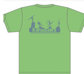
ライムグリーン (シルバー)